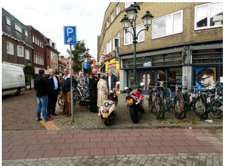
Uitgebreid overleg over de gestalde fietsen en scooters

Ook overlast van fietsen en wild-parkeren van (vracht)auto's bij de nieuwe vestiging van Xenos en het fitnesscentrum aan de Landstraat vroegen de nodige aandacht.