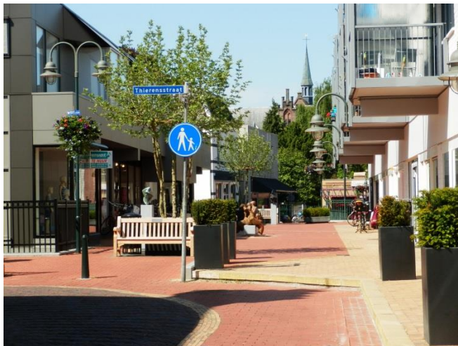
Zo kan het ook! De Nieuwe Brink ziet er zo een stuk beter uit.

Wij hebben aangegeven dat het er na die eerste drie maanden in het centrum rommeliger en meer vervuild door is geworden.