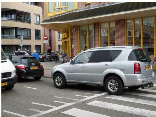
Veel verkeersdruk in het centrum

Ondertussen is gebleken, dat dit niet haalbaar was. In het voorjaar van 2015 werd het overleg weer opgestart. Besluitvorming wordt in het najaar van 2015 verwacht.