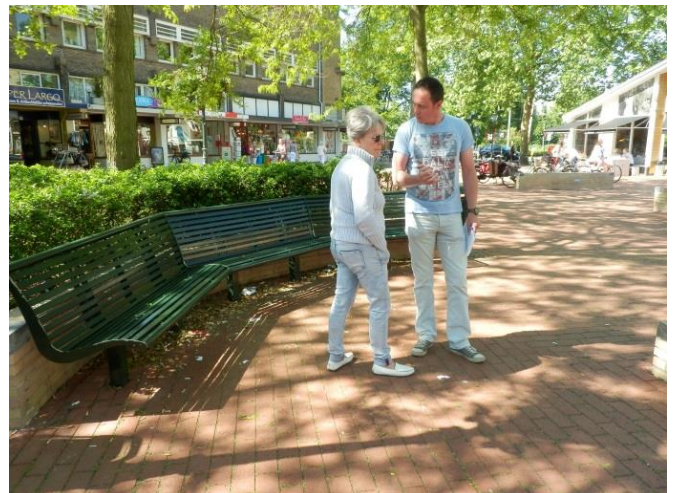
Discussie met wijkbeheer over onkruid en zwerfvuil op straat