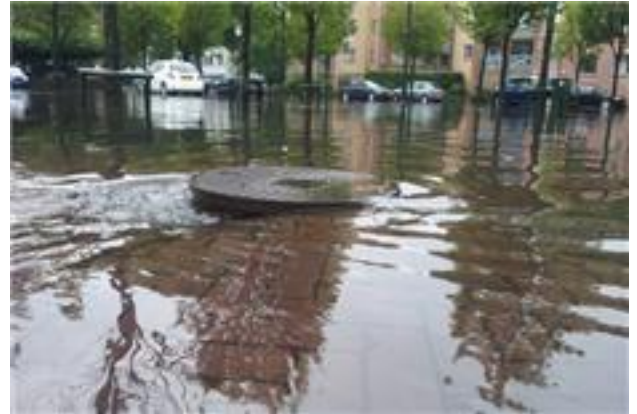
Kan de Bussumse riolering 'het' aan?