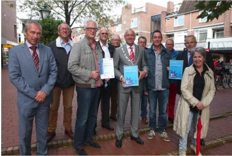
Derde ster KVO

(KVO) wordt erkend dat het dorpshart van Bussum er op vele punten goed voor staat. Om deze mijlpaal te bereiken is er door de Bussumse Ondernemersvereniging, de gemeente en KVO adviseur Maarten van Weel vele jaren hard gewerkt. De wijkschouw kende deze keer dan ook een fors aantal deelnemers. Het grootste item was dit keer opnieuw de fietsenoverlast rond de kruising Havenstraat Landstraat. Gelukkig heeft de gemeente vrij kort daarna het aantal fietsenrekken uitgebreid.