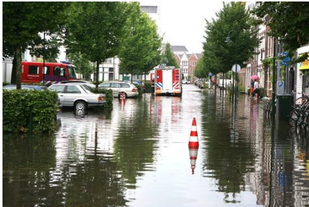
Straten stonden lang blank

Door het bestuur van onze BPV is daarnaast gepleit voor een goede overstort op de gracht achter het gemeentehuis.