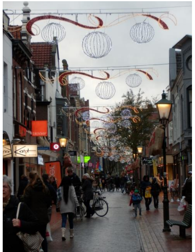
Gezellige drukte in het centrum