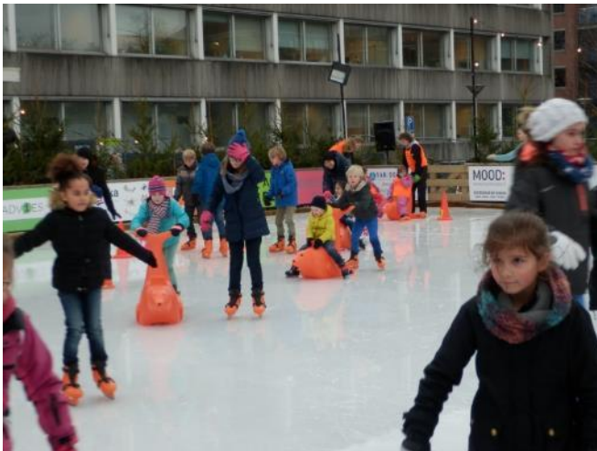
Vanaf dit jaar weer ijspret!

De verbouwing van het gemeentehuis zit er weer op, zodat het parkeerterrein gelukkig weer beschikbaar is voor Bussum op IJs. Er kan weer schaatsles gegeven worden en naar hartenlust geschaatst! Dit jaar is het de 10 keer. Bij de aanpassing van het parkeerterrein in 2018 zal in elk geval rekening gehouden worden met de mogelijkheid van dit evenement in de toekomst