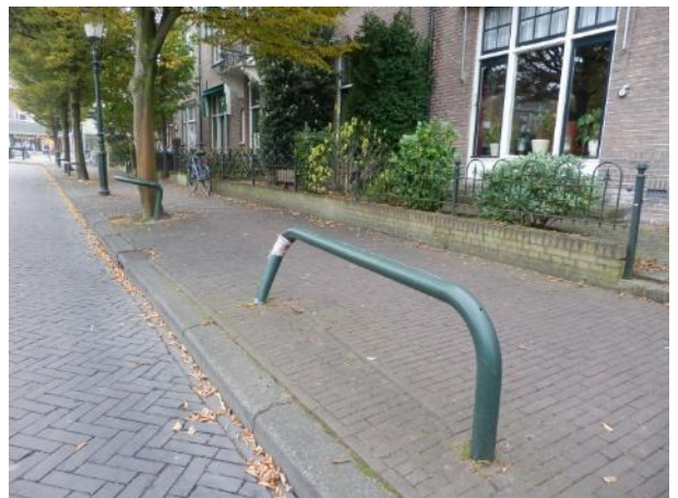
Hopeloos geval, want zo'n beugel is niet meer in productie

Opnieuw is de op het Wilhelminaplantsoen aangereken bus voor nr. 12 gemeld. Dit type bus is echter niet meer in productie. Een andere oplossing is nog niet voorhanden.