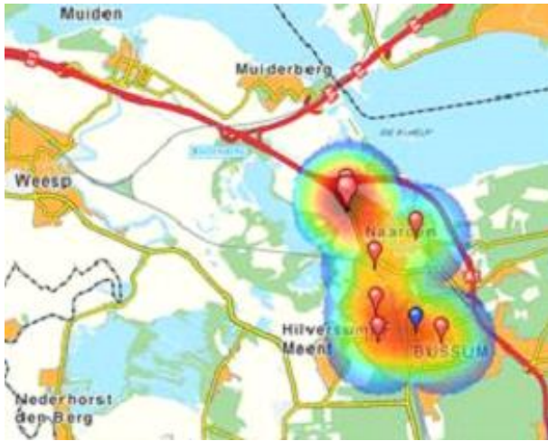
Inbraken in Naarden en Bussum - voorjaar 2017