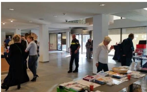
De veiligheidsmarkt in de hal van het verbouwde gemeentehuis.