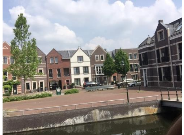
Deze hangplek is gelukkig opgeheven

De bank op de Brediuskruising is vervangen door 16 fietsenbeugels die soelaas kunnen bieden aan de drukte met fietsen bij het Filmhuis en Archibald.