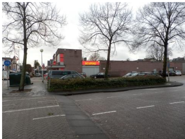
Het is hoog tijd om van deze lelijke hoek iets moois te maken

De mening van de bewoners is toch duidelijk!