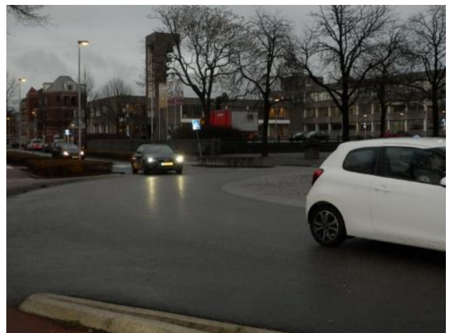
Invallende duisternis en rustiger momenten waardoor auto's harder rijden zijn vol risico's!

'BPV centrum Bussum' heeft tijdens workshops, inspraakavonden en op de Politiekeavond van 15 november jl. continue pleidooi houden voor het noodzakelijke aanscherpen van het kaderplan voor het verkeer in het centrum. Het is veel te druk door doorgaand verkeer. De oversteekbaarheid van de straten in het centrum is problematisch. Diverse stoepen en fietspaden zijn onveilig door spookrijders. Met name als de duisternis valt zijn er meer nog meer risico's op ongevallen.