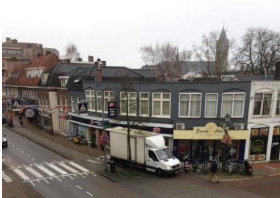
Gekker moet het niet worden

Ook de excessen bij het laden en lossen kwamen aan de orde.